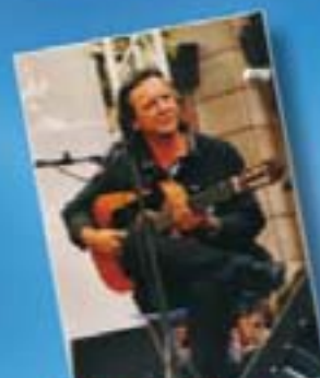
Sasha Gerofejff Klassische & mediterrane Gitarre